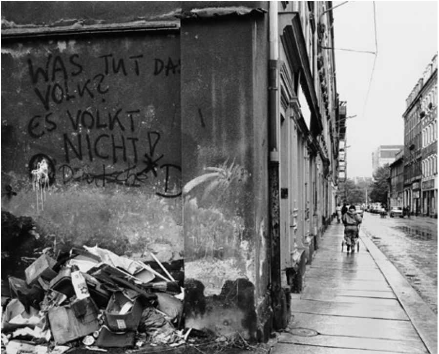
Graffiti aus Dresdens Neustadt, 1990

merwahlen am 18. März 1990 wählte die Mehrheit der Ostdeutschen das Parteienbündnis, welches für den sofortigen Beitritt zur BRD stand und ergriffen so die Chance für ein Leben in der globalen ersten Welt .