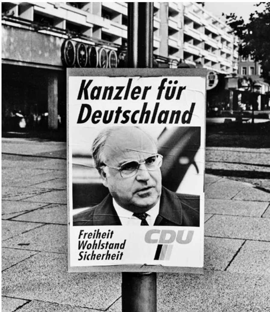
»Wende«-Kanzler Kohl im Wahlkampf, Oktober 1990